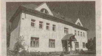
Škola dnes.